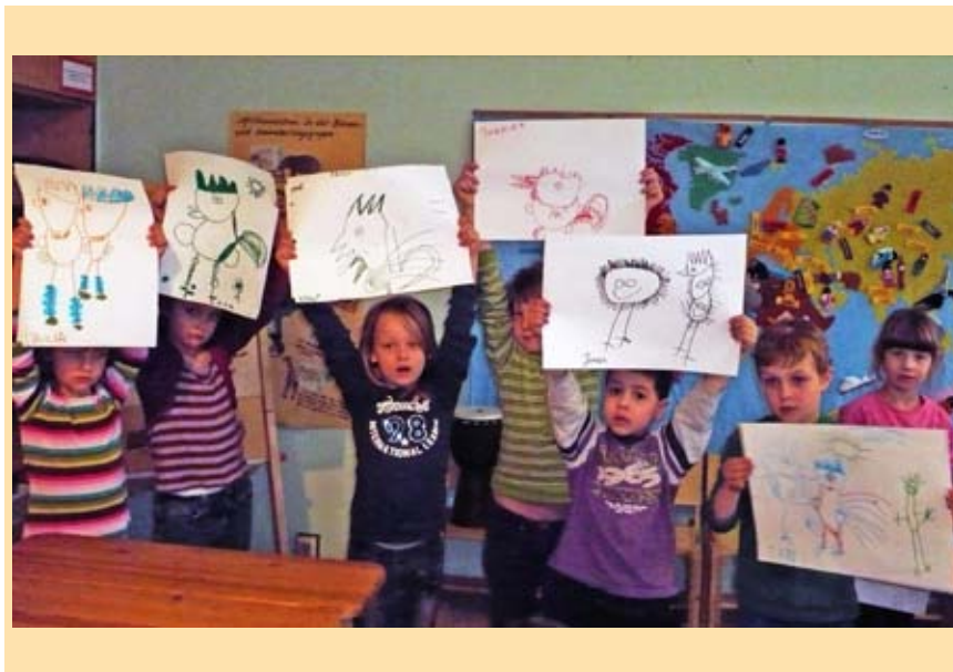
Die Kinder zeigen stolz ihre Gockelvariationen

Tatsache ist, auch in den nächsten Jahren wird es keine Mittel geben, um diese Kita gründlich zu sanieren und sie damit auch optisch aufzuwerten. Die Mitglieder des Ortsvereins beschlossen deshalb im vergangenen Jahr zu helfen und etwas für das Äußere dieser Einrichtung zu tun. Anträge wurden geschrieben und Geld gesammelt. Tatsächlich wa-