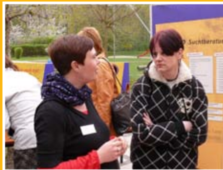
Wenn „Daddeln“ zur Sucht wird Seite 10