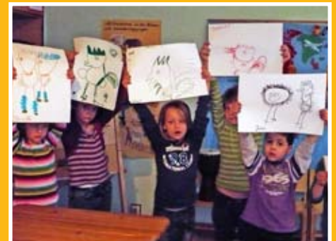
Schönheitskur für den „Goldenen Gockel“ Seite 13