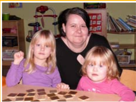
Wer sind die armen Kinder? Seite 9

Das Gesetz zur Ermittlung von Regelbedarfen und zur Änderung von SGB II/SGB XII